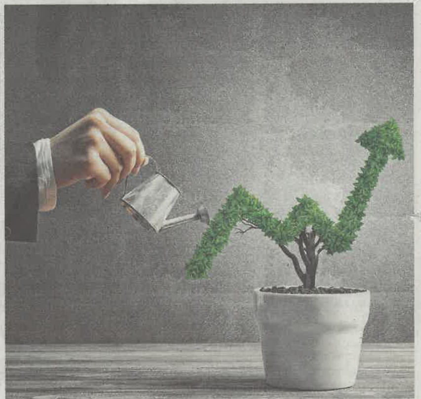
Hay referencias de inversiones responsables desde el siglo XVII

Ahora importa invertir en empresas y actividades que no solo ofrezcan rentabilidad sino también que sean respetuosas con los derechos humanos, por ejemplo que no empleen mano de obra barata y explotada, que favorezcan la diversidad en los altos cargos, que utilicen energías limpias, se